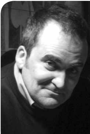
Пише: Zoran Jeremić

Koliko nas je samo puta nasamarila ta frajla Istorija u rukama njenih nedotupavnih ljubavnika! Koliko puta je ta đevuška promenila naklonost i ruho!